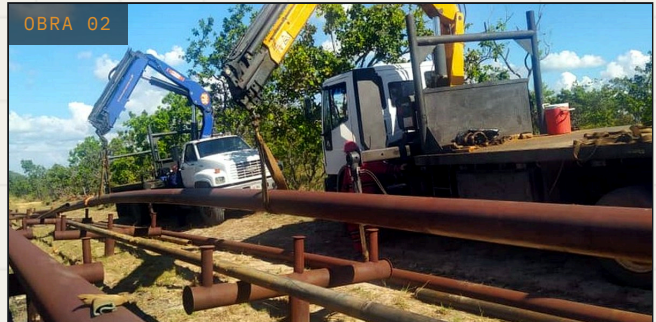
OBRA 02 LÍNEAS Y TUBERÍAS PDVSA · San Diego de Cabrutica Reemplazo de línea de crudo y diluyente San Diego de Cabrutica, Anzoátegui