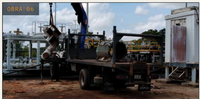
OBRA 06 ELÉCTRICA · MECÁNICA · INSTRUM. PDVSA · San Diego de Cabrutica Recuperación de facilidades en macolla San Diego de Cabrutica, Anzoátegui