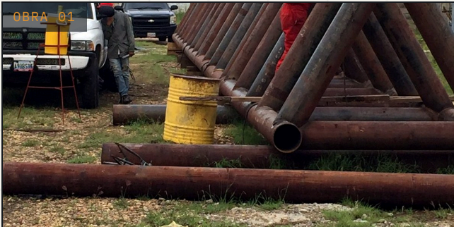
OBRA 01 SISTEMAS DE ANTORCHA Planta PetroIndependencia Flare de 34 m – ingeniería, fabricación e instalación Faja Petrolífera del Orinoco