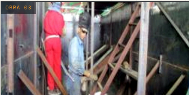
OBRA 03 TANQUES DE ALMACENAMIENTO Industria petrolera Tanques de crudo de 500 barriles (API 650) Oriente de Venezuela