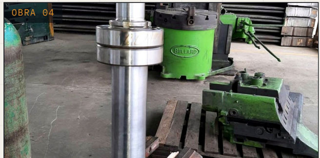
OBRA 04 EQUIPOS ROTATIVOS Mejorador PetroCedeño, S.A. Reparación de bombas y motores Complejo Industrial José, Anzoátegui