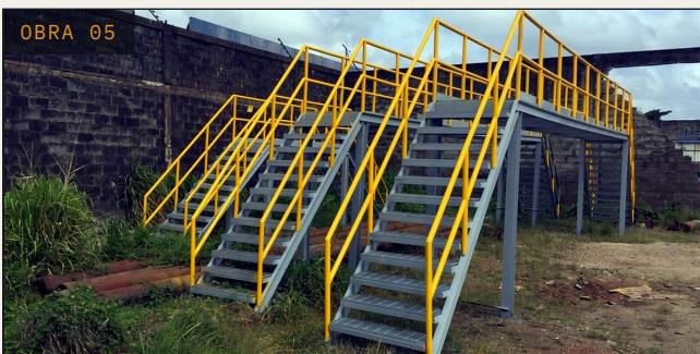
OBRA 05 ESTRUCTURAS METÁLICAS Mejorador SINOVENSA Fabricación de pasarelas industriales Morichal, Monagas